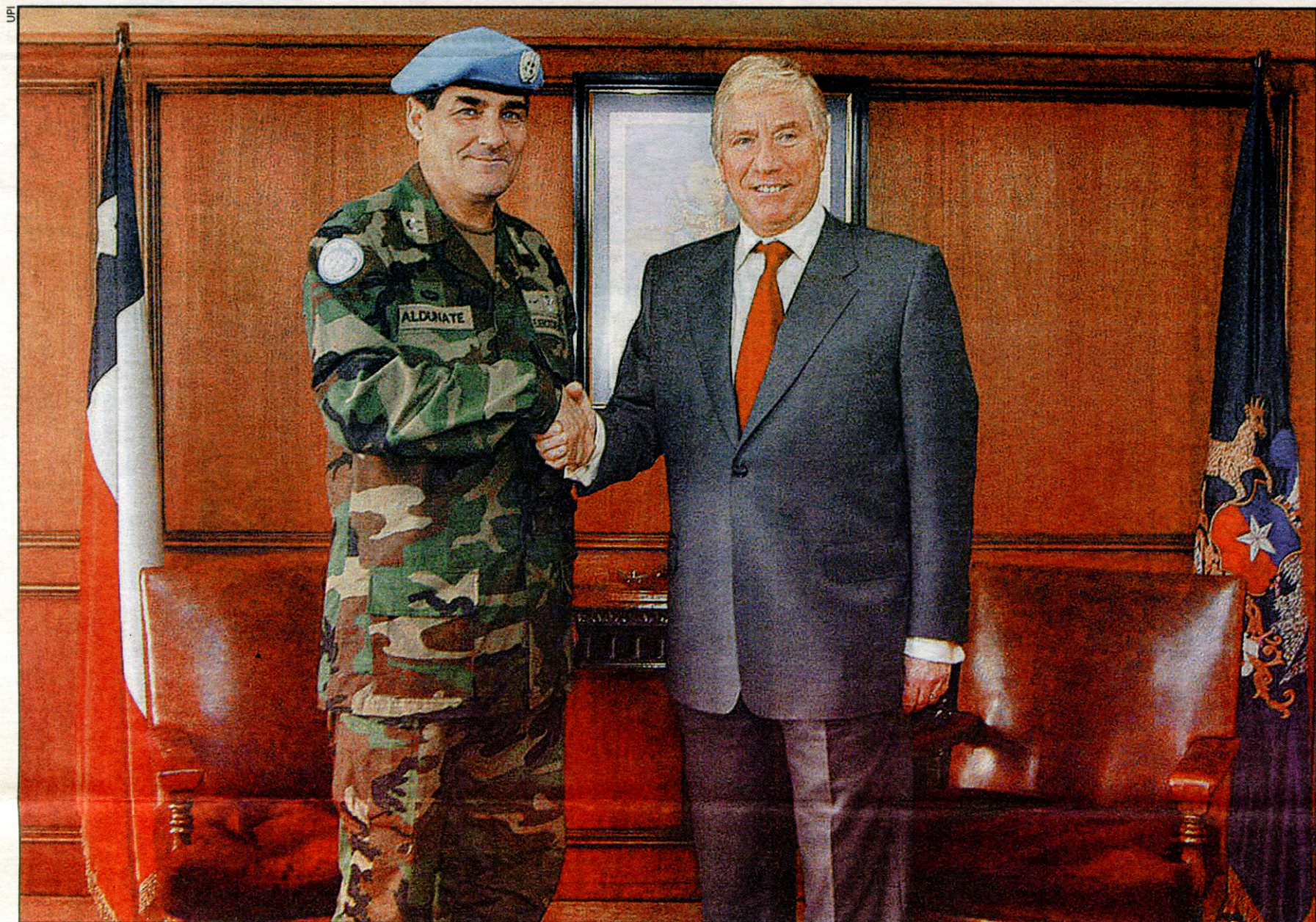
El general de brigada Ludovico Eduardo Aldunate junto al ministro de Defensa, Jaime Ravinet, antes de viajar a Haití. El militar no perteneció a la brigada Mulchén de la Dina, pero sí a la Central Nacional de Informaciones (CNI).