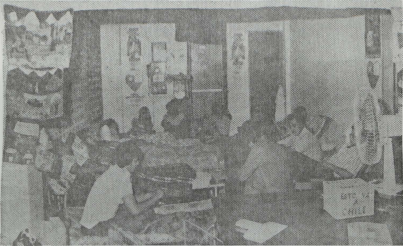
El grupo de huelguistas, seis hombres y cuatro mujeres, conversan con el redactor.

Seis hombres y cuatro mujeres, exiliados chilenos, arribaron hoy al cuarto día de la huelga de hambre que mantienen en la sede del Colegio Nacional de Periodistas, exigiendo al régimen militar de su país que aclare la situación de 2.500 presos políticos desaparecidos.