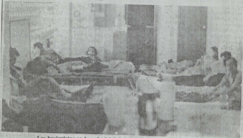
Los huelguistas en la sede del Colegio de Periodistas.

El candidato presidencial del MAS, José Vicente Rangel, visitó ayer a los once chilenos que se encuentran en huelga de hambre en demanda de un pronunciamiento definitivo del gobierno de Pinochet sobre el paradero de dos mil quinientos desaparecidos.